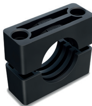
Vzájemné přiřazení mezi skupinou podle DIN 3015-2 a skupinou DCE-H